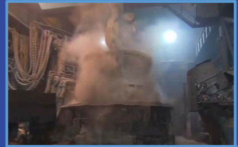
Elektrolichtbogenofen bei DEW

Ebenso wenig werden die Konzerne von der Regierung gezwungen, auf ihre Kosten - unter anderem Dieselfahrzeuge -